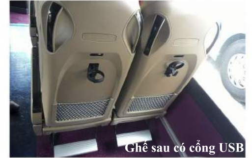
Ghế sau có cổng USB