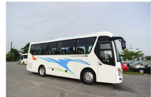
Tổng Quan Xe