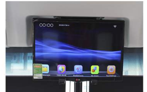
Tivi tích hợp wifi