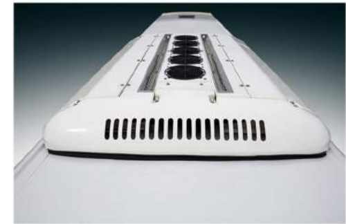
Dáng Xe Sang Trọng